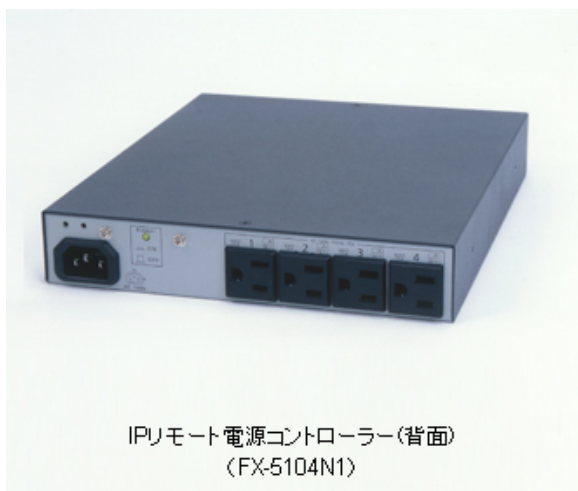
IPリモート電源コントローラー(背面) (FX-5104N1)