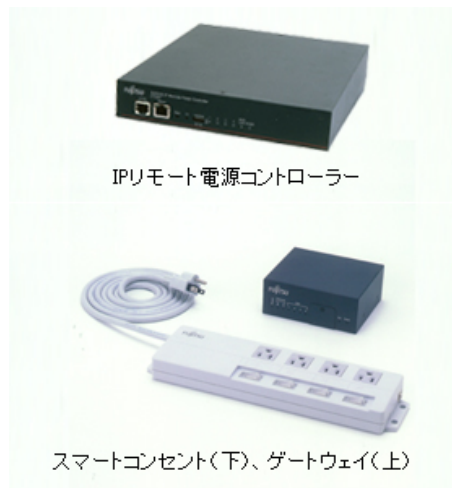
IPリモート電源コントローラー