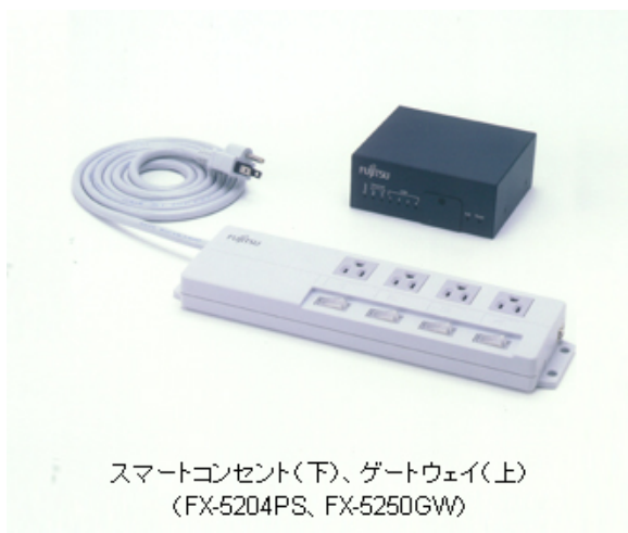
スマートコンセント(下)、ゲートウェイ(上) (FX-5204PS、FX-5250GW)