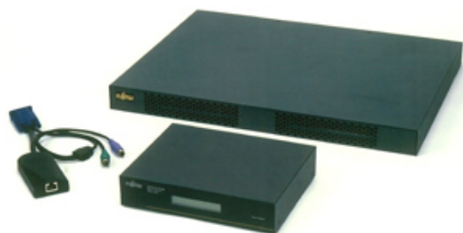
マルチユーザーKVMスイッチ(FS-1616MM)