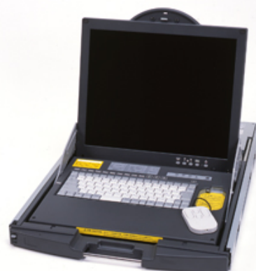
コンソールドロワー(FD-5200シリーズ)