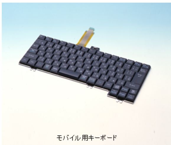
モバイル用キーボード