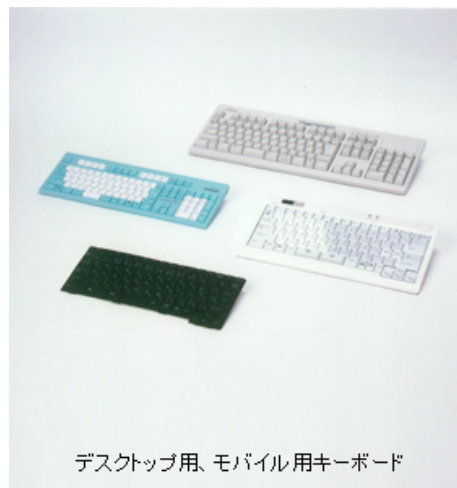
デスクトップ用、モバイル用キーボード